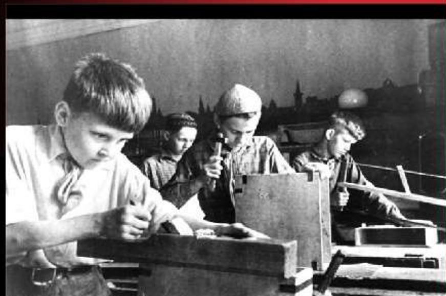
Репортаж из дня вчерашнего